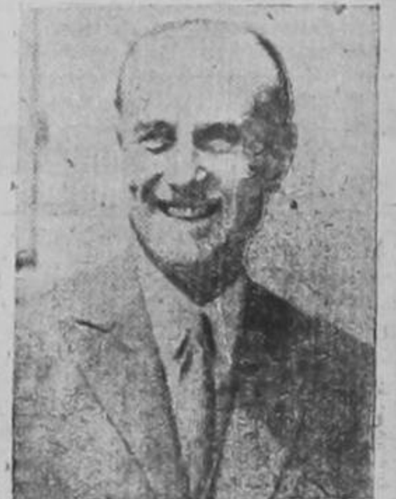
Sir SAMUEL HOARE

PARIS, 28. UP. — El estenógrafo del senado de la república, empleado por el comité encargado de los asuntos del ejército y con acceso a los documentos militares secretos fué arrestado en conexión con el caso de espionaje de Abetz, el cual se ha convertido en el escándalo número uno del país. Es este el tercer arresto practicado por las autoridades en seguir la pista de los malhechores. El arrestado es un joven de veintidós años. (PASA a la página CUATRO)